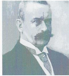
PAUL LECHLER PREIS '14

VERLEIHUNG DES PAUL LECHLER PREISES zur Integration, Selbstbestimmung und Teilhabe behinderter und benachteiligter Menschen.